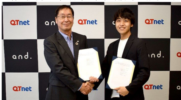
左：QTnet 小倉社長 右：アンドドット茨木 CEO

本製品は、Microsoft 社の Azure OpenAI だけではなく、Google 社が提供する日本語版 PaLM2 も追加し、生成 AI をマルチに利用できる仕様となっています。また、組織内での AI 利用を安全に保つため、企業単位で利用環境を構築し、入力フィルタリングを行うなど高いセキュリティ基準で運用することができます。