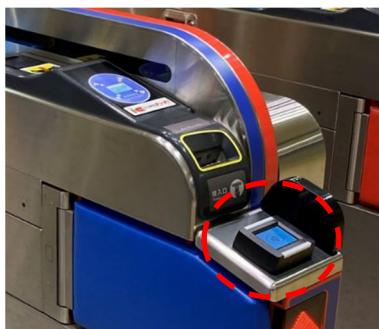
（Visa のタッチ決済読取部）