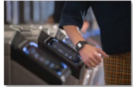
(タッチ決済利用イメージ図)