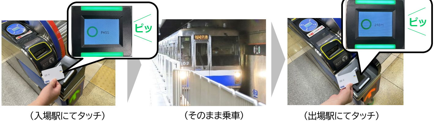
(入場駅にてタッチ)