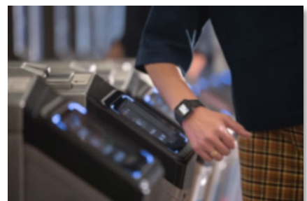
(タッチ決済利用イメージ図)