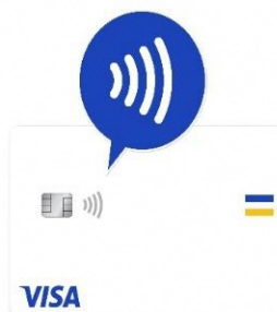
〔対応カードの一例〕