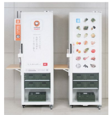
【生鮮宅配ボックス】