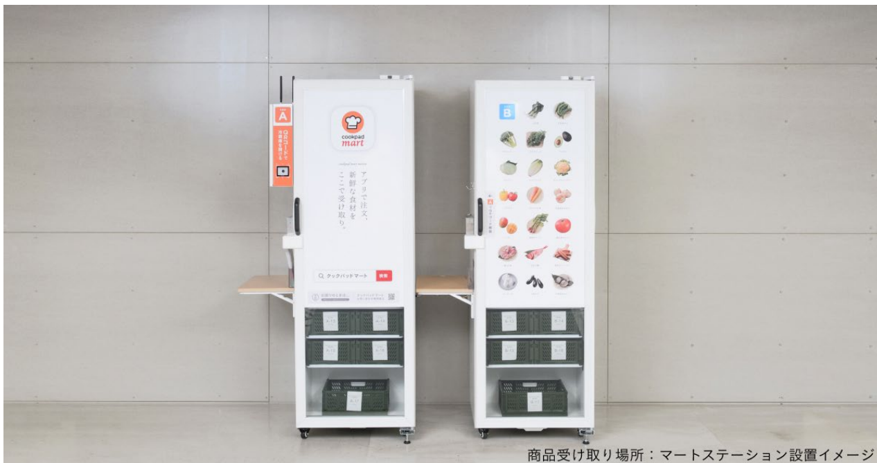
商品受け取り場所：マートステーション設置イメージ

報道の方向けに、クックパッドマートの特徴である生鮮宅配ボックス「マートステーション」への商品配送、及び商品受け取りのデモンストレーションを実施します。取材をご希望の方は「貴社名」「貴媒体」「ご所属部署」「お名前・人数」「お電話番号」「カメラの有無」を記載のうえ、 pr@cookpad.com までご連絡をお願いいたします。