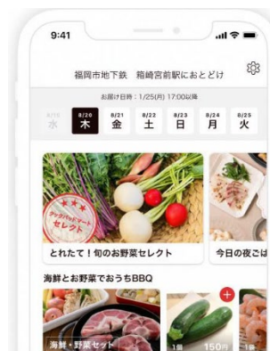
【スマホでの注文画面】