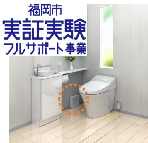
↑ 便器の左下に見えるのがデバイス