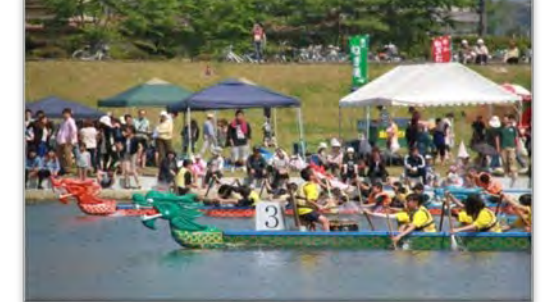
⑯川内川/鹿児島県伊佐市湯之尾/ドラゴンボートレース(5月)