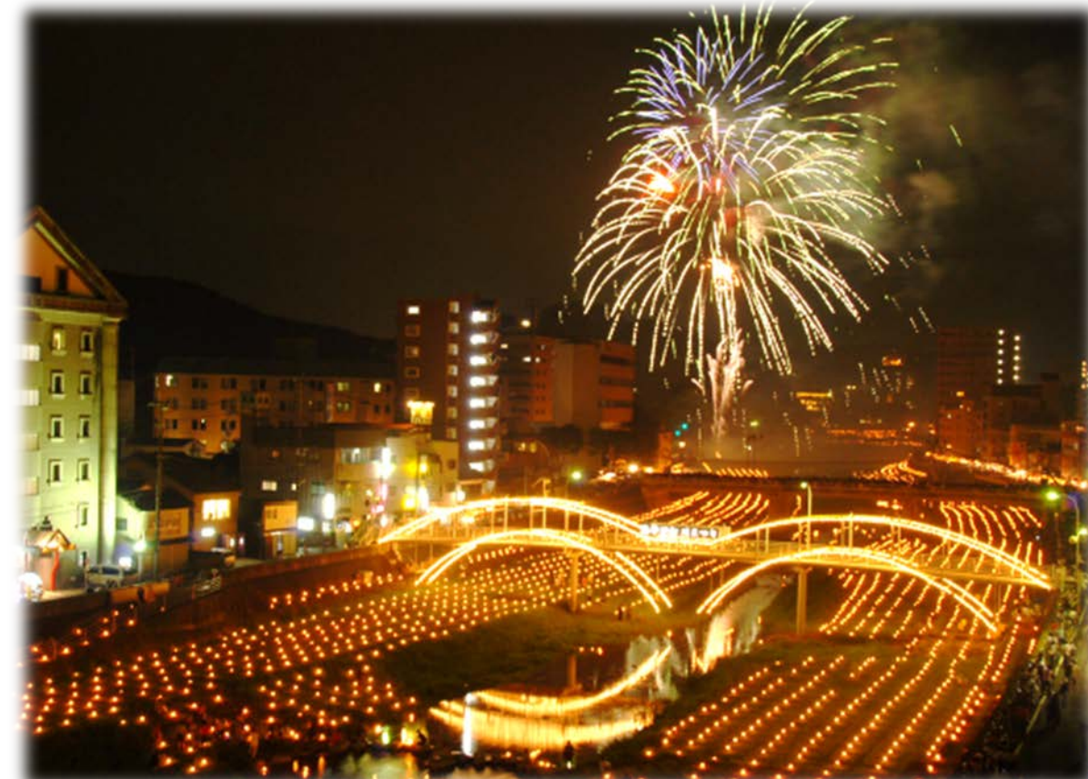
諫早万灯川祭り: 本明川(諫早市)