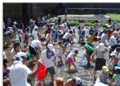
⑧本明川/天満・永昌/魚つかみ取り大会(7月)