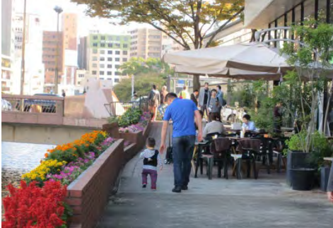
自店舗の前面にテーブル、椅子の設置を認めオープンカフェを実施