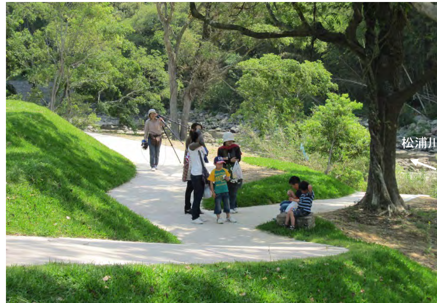
○松浦川(佐賀県) [⑥伊万里市 桃川[完成]/大黒井堰歴史ふれあい広場] 夏は蛍、リバーカヤック体験など、歴史的遺構と相まって地域に親しまれています。