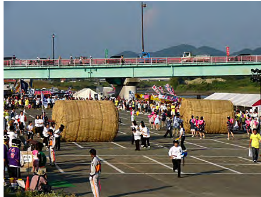
○菊池川(熊本県) [菊池川大俵祭り(熊本県玉名市)] 毎年11月、五穀豊穰に感謝するため、菊池川周辺で開催されるお祭りです。