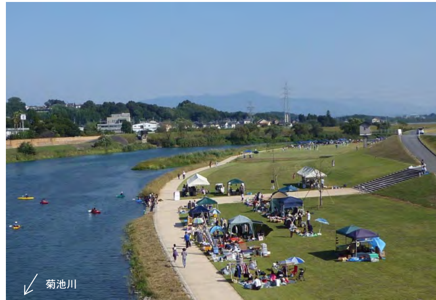
○菊池川(熊本県) [⑨山鹿市 山鹿[完成]/湯ノ瀬川公園] 周辺の山鹿温泉等の魅力と相まって、散策や様々なイベントで親しまれています。

かわまちづくり支援認定箇所:直轄河川:12水系、17箇所 (平成26年7月1日現在)