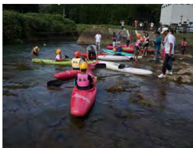
⑥松浦川/桃川/リバーカヤック体験(8月)