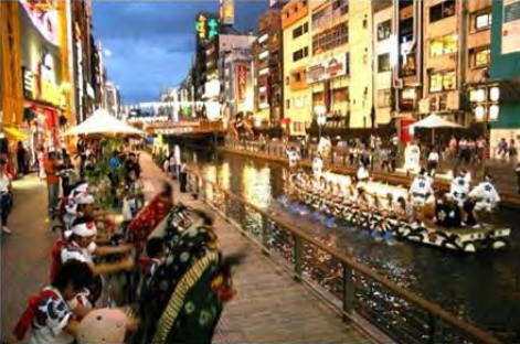
民間事業者によるオープンカフェの設置やイベントの開催