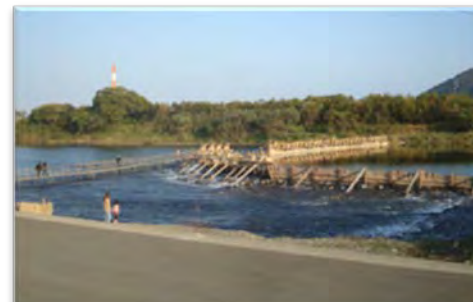
⑭五ヶ瀬川/宮崎県延岡市 川中地区/左から アユヤナ・豊堤